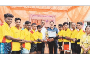
हरिभूमि न्यूज ►► कटघोरा