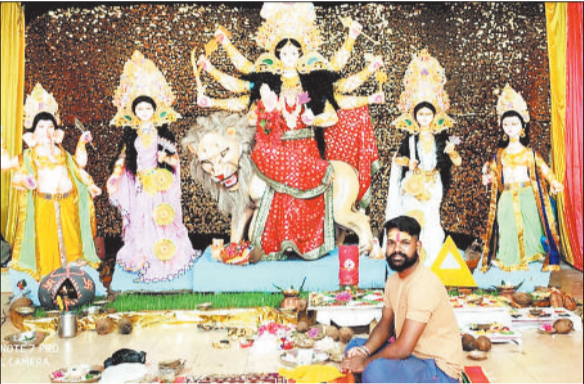
सार्वजनिक नव दुर्गात्सव समिति बरपाली