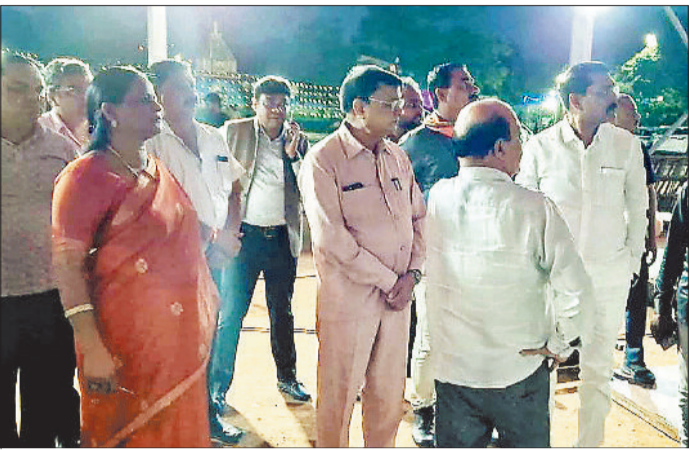
रामलीला स्थल करते उद्योग मंत्री श्री देवांगन, महापौर, भाजपा जिला अध्यक्ष श्री मोदी।

उद्योग, वाणिज्य, श्रम, आबकारी व सार्वजनिक उपक्रम मंत्री लखनलाल देवांगन ने घंटाघर ओपन थियेटर मैदान स्थित रामलीला स्थल पहुंचकर रामलीला आयोजन की तैयारियों का जायजा लिया। उन्होंने भव्य रामलीला आयोजन हेतु की जा रही तैयारियों के संबंध में अधिकारियों को आवश्यक निर्देश भी दिए।