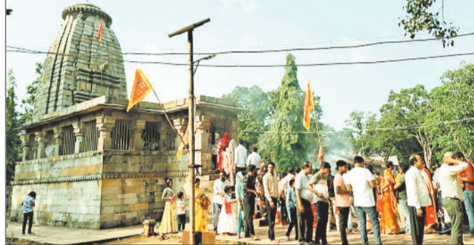
चैतुरगढ़ मंदिर में लगी भक्तों की कतार।