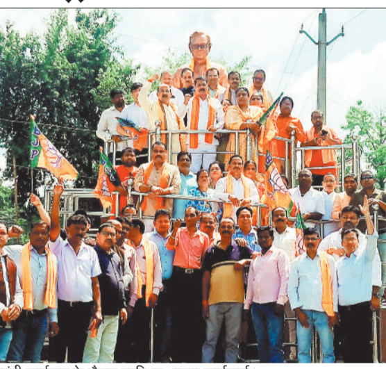
जयंती कार्यक्रम के दौरान उपस्थित भाजपा कार्यकर्ता।

राष्ट्रीय स्वयंसेवक संघ के संतानकर्ता, भारतीय जनसंघ के अध्यक्ष पंडित दीनदयाल उपाध्याय की जयंती अवसर पर घंटाघर निहारीका में उनकी प्रतिमा पर माल्यार्पण कर स्मरण किया गया।