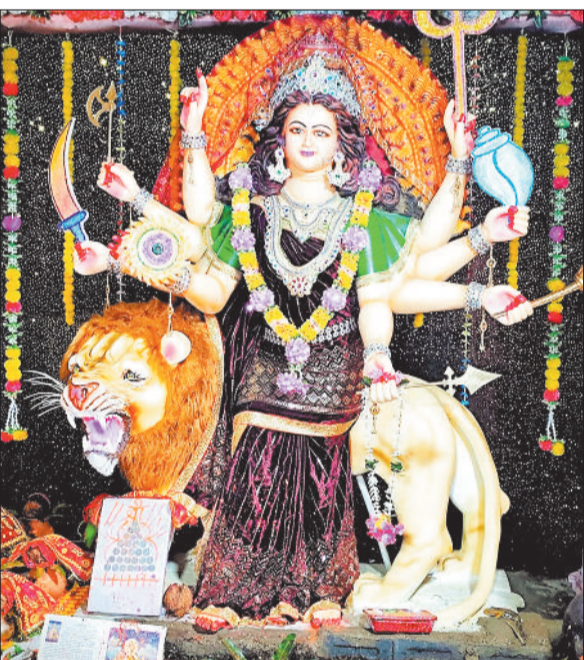
जय महाकाल दुर्गा उत्सव समिति ग्राम सुखरीकला