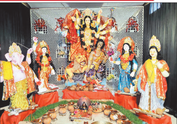
नव दुर्गा उत्सव नवयुवा समिति अयोध्यापुरी गोड मोहल्ला।