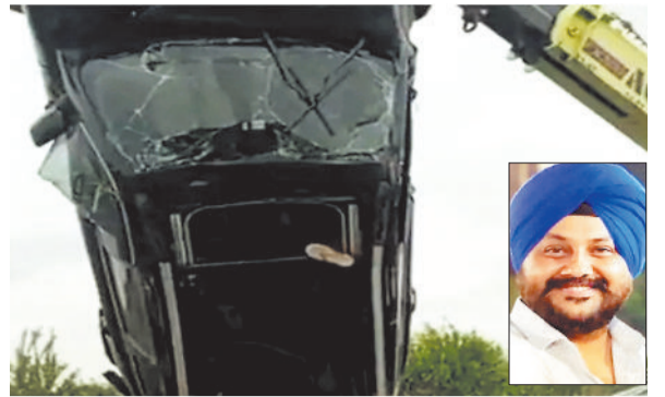
सड़क हादसे में दुर्घटनाग्रस्त कार व इनसेट में मृतक।