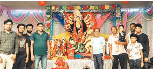
चैनपुर बेलटिकरी बसावट।