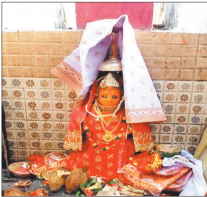
मां कोसगाई दाई।

लगातार दो दिन से रुक रुककर हो रही बारिश से नवरात्रि में होने वाले गरबा नृत्य में लोगों की भीड़ कम नहीं हो रही है। देर शाम होते ही महिलाओं और युवतियों की भीड़ डांडिया मैदान में पहुंचने लगती है जो देर रात तक आदिशक्ति की भक्ति में किए जाने वाले इस गरबा नृत्य में डूबी नजर आती है। ठीक इसी तरह पहाड़ों में विराजी माता के दरबार में भी ग्रामीण अंचलों के भक्त झूमते हुए पहुंच रहे हैं। करतला विकासखंड में डंगनाई पहाड़ पर विराजित मां डंगनाई देवी करतला और कोरबा विकासखंड क्षेत्र के भक्त बड़ी संख्या में डंगनाई पहाड़ पहुंच रहे हैं। इसी तरह मड़वारानी पहाड़ में हमेशा पुरानी परंपरा के तहत पंचमी के दिन से नवरात्र की शुरुआत हो रही है। इस अवसर पर शनिवार को मड़वारानी के आसपास के ग्रामीण क्षेत्रों के भक्त जवावा बोनो और कलश स्थापना के लिए बड़ी संख्या में पहुंचे हुए थे। शाम होते ही वहां भक्तों की भीड़ पहले दिन से ही लगनी शुरु हो गई थी। अंचल के सबसे प्रसिद्ध चैतुरगढ़ पहाड़ पर स्थित मां महिषासुर मर्दिनी मंदिर में भी ज्योति कलश प्रज्वलित किए गए हैं। 950 तेल एवं 90 घी के ज्योति कलश है तथा 11सी च्यार कलश स्थापित किए गए हैं। चैतुरगढ़ में जिले के अलावा बिलासपुर, रतनपुर एवं पेंडा क्षेत्र के भक्त पहुंच रहे हैं। पहाड़ों पर स्थापित आदिशक्ति के दरबार में एक और दरबार मां कोसगाई देवी का है। अजरबहार से 12 किमी दूर कोसगाई पहाड़ पर कोसगाई देवी का मंदिर है। पुरातत्व विभाग द्वारा संरक्षित इस पहाड़ में कोसगाई देवी के दर्शन के लिए बालको क्षेत्र