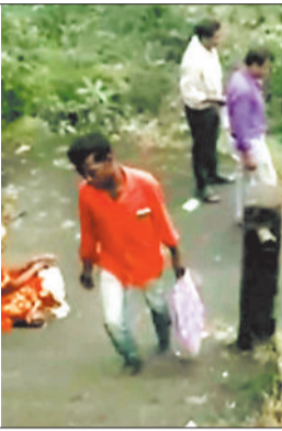
दर्शन के लिए पहाड़ चढ़ते भक्त।