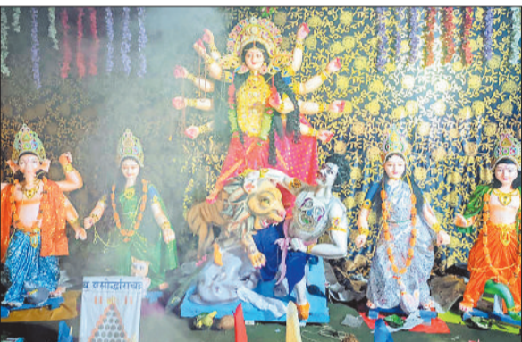
सार्वजनिक उत्सव पाटियापाली।