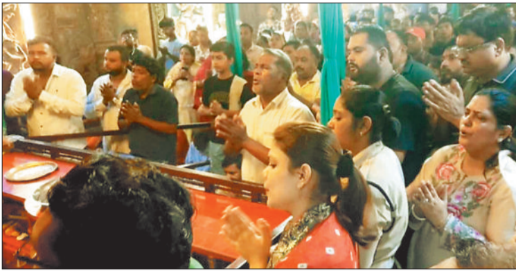
सर्वमंगला मंदिर में श्रद्धालुओं का लगा तांता।