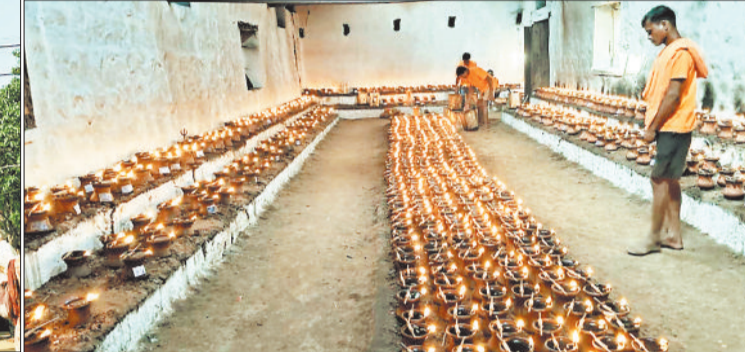
मंदिर में प्रज्वलित मनोकामना ज्योति कलश।