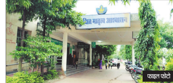
हरिभूमि न्यूज ►► कोरबा

सरकार ने कोयले पर लगने वाले कंपनसेशन सेस 400 रुपये प्रति टन को पूरी तरह समाप्त कर दिया है। वहीं कोयले पर जीएसटी को 5 प्रतिशत से बढ़ाकर 18 प्रतिशत किया गया है। इन दोनों के संयुक्त प्रभाव से छत्तीसगढ़ राज्य विद्युत उत्पादन कंपनी को औसतन अनुमानित 152.36 रुपये प्रति टन कम लागत पर कोयला प्राप्त होगा, जिससे कंपनी की उत्पादन लागत में औसतन 11.54 पैसे प्रति यूनिट कमी संभावित है। कंपनसेशन सेस विद्युत उत्पादन लागत में एक बड़ा मुद्दा था, जिसमें राहत मिलने से उत्पादन लागत में कमी का मार्ग प्रशस्त होगा जो केन्द्र सरकार की मंशा के अनुसार विद्युत उपभोक्ताओं को भी लाभान्वित करेगा।