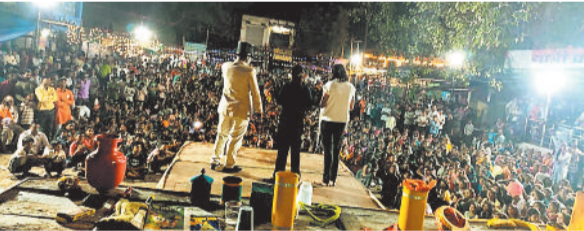
जादूगर करतब दिखाता।