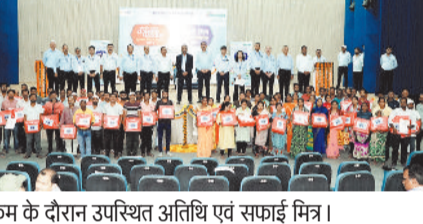
कार्यक्रम के दौरान उपस्थित अतिथि एवं सफाई मित्र।