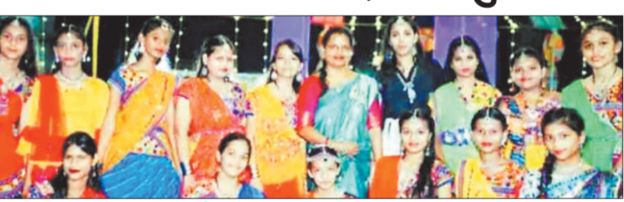
गरबा डांडिया कार्यक्रम में उपस्थित प्रतिभागी।